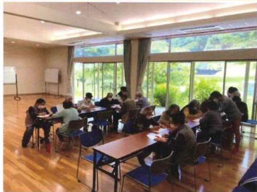
→点つなぎに挑戦中

100円で遊ぶDAYに関するお問い合わせは NPO 法人スサノオの風 (0853)84-0833 まで。