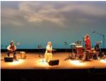
↑ 歌子さんらによるステージ公演

12月10日(日)、スサノオホール内で「スサノオの里こどもフェスティバルinさだ」を開催しました。 当日はあいにくの天気でしたが、各ブースを楽しみながら歩く親子で会場は賑わいをみせていました。 このイベントは、公演のみならず館内で使える場所を活用した形で実施。法人の今後の事業展開を見据えた取り組みと言えます。