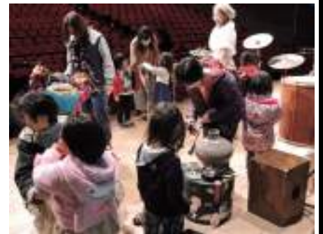
↑ 終演後の『民族楽器体験』の様子