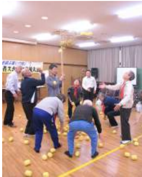
↑玉入れ競技を行う参加者の皆さん

スサノオの里障がい者スポーツ大会 10月6日(金)、文化練習館で「第39回障がい者スポーツ交流大会」が行われました。これは、障がい者の皆さんと軽スポーツを通して、社会参加や交流を深めていこうと毎年開催しており、今回も佐田支所など様々な団体の協力を得て賑やかに開催することができました。玉入れやポケットボールなどの競技が用意され、参加者は同じチームの声援を受けながら熱心に競技に取り組みでいました。