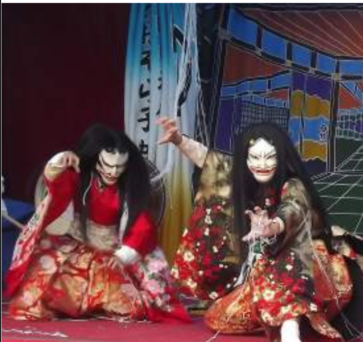
↑今回2演目披露する「NPO 法人あおぞら子供神楽団」

11月3日(金・祝)にスサノオホールで『こども芸能大会(佐田町文化協会主催)』が開催されます。これは、全国の神々が集う11月の神在月に児童による伝統芸能が数多く存在する佐田町を会場に、特色ある芸能の発表と交流を目的に開催します。出演は、町内から大人の団体も含めた8団体が参加、町外からは3団体、ゲストとして『NPO 法人あおぞら子供神楽団(広島市)』が出演します。秋の行楽はぜひご家族そろってスサノオホールへお越しください。