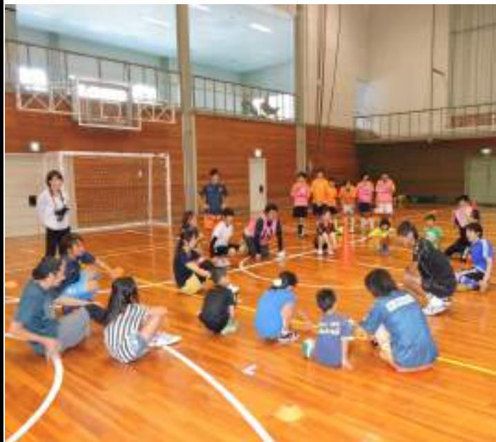
↑フットサルの説明を真剣なまなざしで聞く参加者

三回目を数える スポーツ体験事業 八月二十三日(日)、佐田スポーツセンターで、スポーツ体験事業が行われ、町内外から二十四名が参加、ミニフットサルを楽しみました。 これは、スポーツを気軽に体験してもらおうとスサノオの風が今年度から実施しているもので三回目となります。今回は試合で得られるチームワークの大切さや得点した時の喜びを体験していただくとうと試合形式主体の『交流大会』として実施しました。