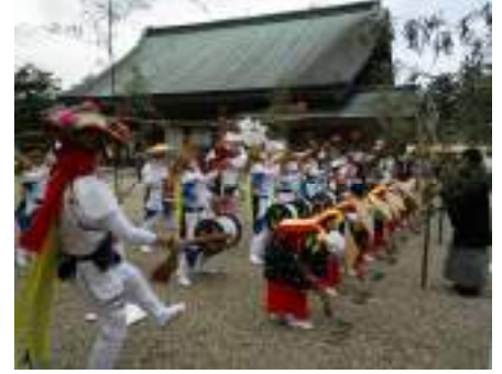
「田植舞」が奉納される様子

当日一行は、松の参道での神職による「射の儀式」などが執り行われた後、列を成して華やかに練り歩きながら鳥居から仮殿へ、そして所定の位置へと進んでいきました。 その後、早乙女らが華やかに「田植舞」を舞い踊り、集まった観光客を魅了していました。