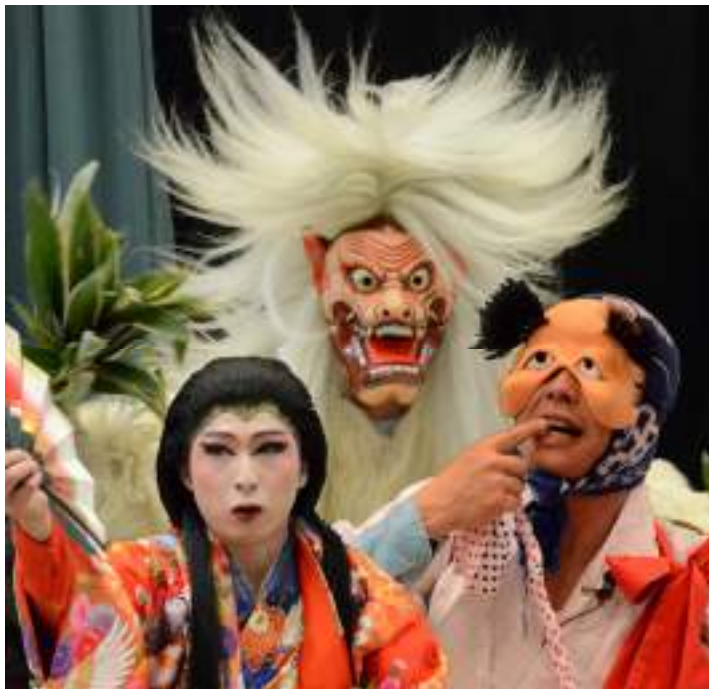
↑今回出演する「宮乃木神楽団」による新作「源頼政」

毎年恒例となった神楽の共演大会「スサノオの里神楽舞」を9月27日(日)に実施します。これは、スサノオの風が主催で行うもので、窪田神楽社中の皆さんによることも神楽「四方剣」で幕が上がり、その後「芸州神楽特集」と題し、人気のある四団体が迫力ある演舞を披露します。