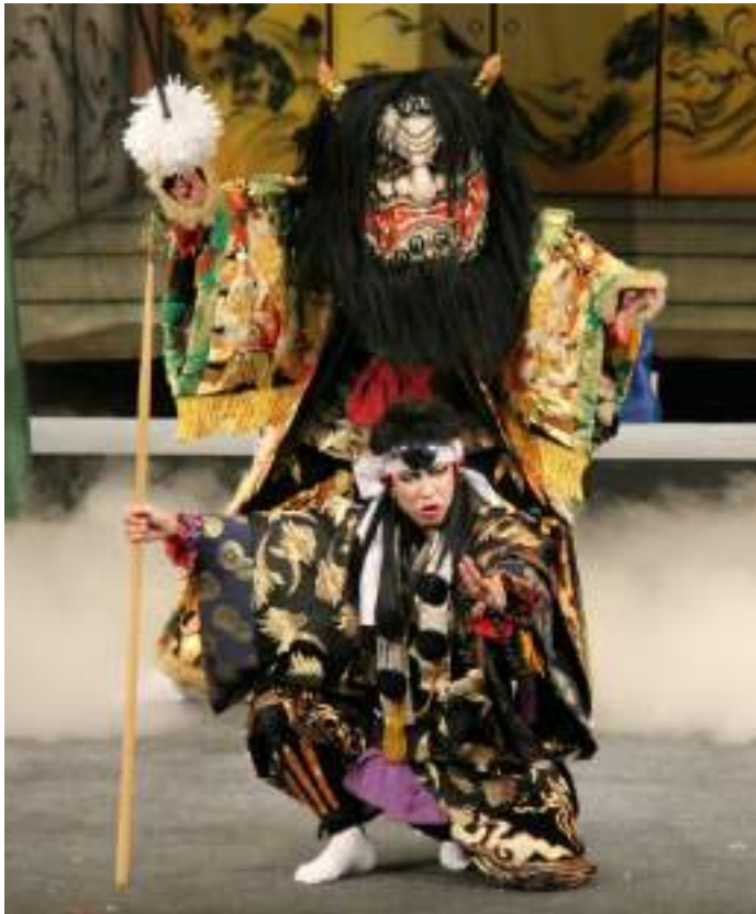
→今回出演する宮乃木神楽団(「大江山」源頼光・酒吞童子)

昔から牛馬を食さなかった日本人は、猪肉を山くじらと呼び貴重なタンパク源として食してきました