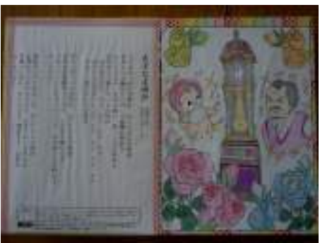
↑キレイな色が塗られた童謡詩集

室内には、細やかな作りで目を引く作品や、きれいに色が塗られた昔懐かしの童謡詩集などが華やかに飾られていますので、ぜひご来場ください。(毎週月曜日は休館日)