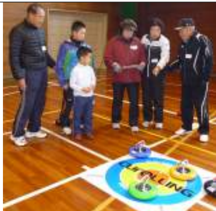
→ 昨年の様子 (得点は...高得点?)

小さな子どもさんから大人の方までどなたでもご参加いただけますので、お誘い合わせのうえぜひご参加ください。