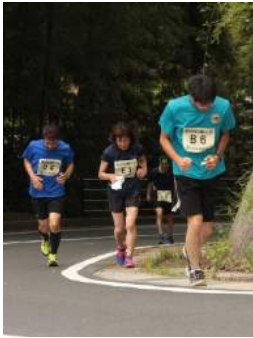
↑最後の難所であるゴール前の坂道に挑戦!

参加者の最高年齢者は、町内の七十七歳の男性で5km部門に参加し、完走されました。