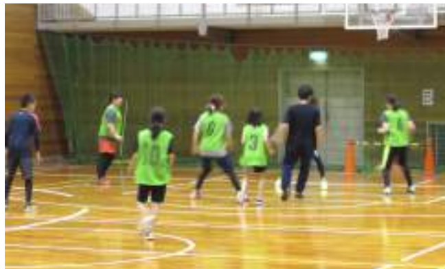
←前回実施した「フットサル体験会」

スサノオの風では、誰でも気軽に軽スポーツや珍しいニュースポーツを体験してもらおうと、スポーツ体験会を計画しています。 第三回目として、以前実施した『ミニフットサル』の交流大会を八月二十三日(日)に佐田スポーツセンターで開催します。 ルールは独自に設定し、三人一組で主に試合形式中心に行います。子どもや女性でも参加しやすくなっております。ぜひ夏休みを利用して、ご家族揃ってご参加ください。