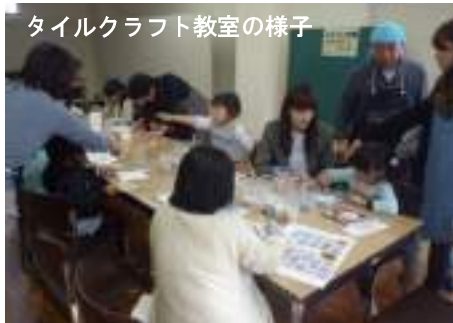
↑タイルクラフト教室の様子

また、会場内で『出雲商業高校吹奏楽部』の皆さんによる吹奏楽演奏も披露され、迫力ある吹奏楽の音色でまつりに華を添えていました。最後は恒例の「大抽選会」があり、参加者は当選番号が呼ばれるたびに一喜一憂していました。