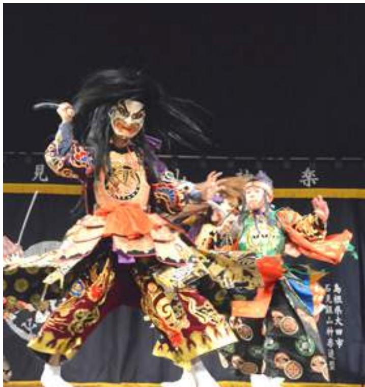
→今回特別参加が決定した土江子ども神楽団

十一月三日(火・祝)にスサノオホールで『こども芸能大会』が開催されます。 これは、児童による芸能が数多く存在する佐田町で、継承されてきた芸能を広く町内外へ発信できればとの思いから計画されたもので、市内各地から選りすぐりの団体が多数出演します。 内容は、和太鼓や安来節、歌舞伎や神楽といった佐田でもゆかりがある伝統芸能から、キッズダンスなど現代で創造された芸能など様々な団体が出演します。 また、特別ゲストとして大田市から『土江子ども神楽団』を招聘、「桃太郎」、「剣田」の二演目を午前十と午後二に舞っていただきます。秋の行楽はぜひスサノオホールへお越しください。