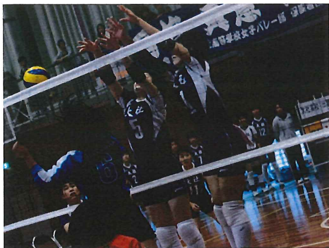
↑ 第1回スサノオの風杯バレーボール大会