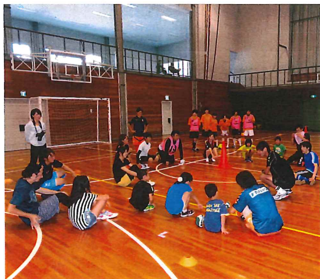
↑ フットサル体験教室