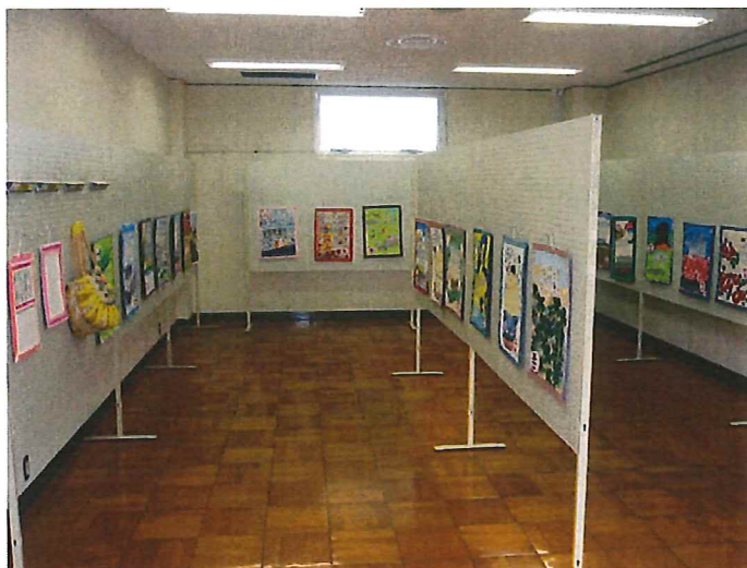
← スサノオホール展示室を利用したの 作品展示（やまゆり苑利用者の方の作品）