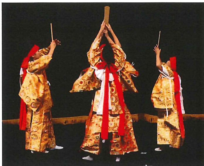
← 27.9.27 スサノオの里神楽舞2015 窪田神楽社中による「四方剣」。