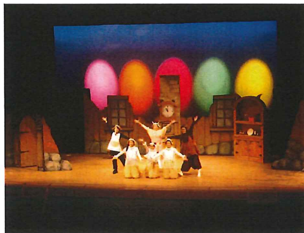
↑ 28.3.13 劇団Yプロジェクトによる 音楽劇「おおかみとこやぎ」。